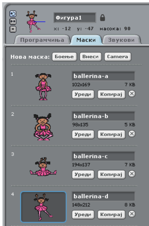
Изглед на панелот за маски